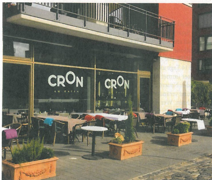
Das ist die Krönung!